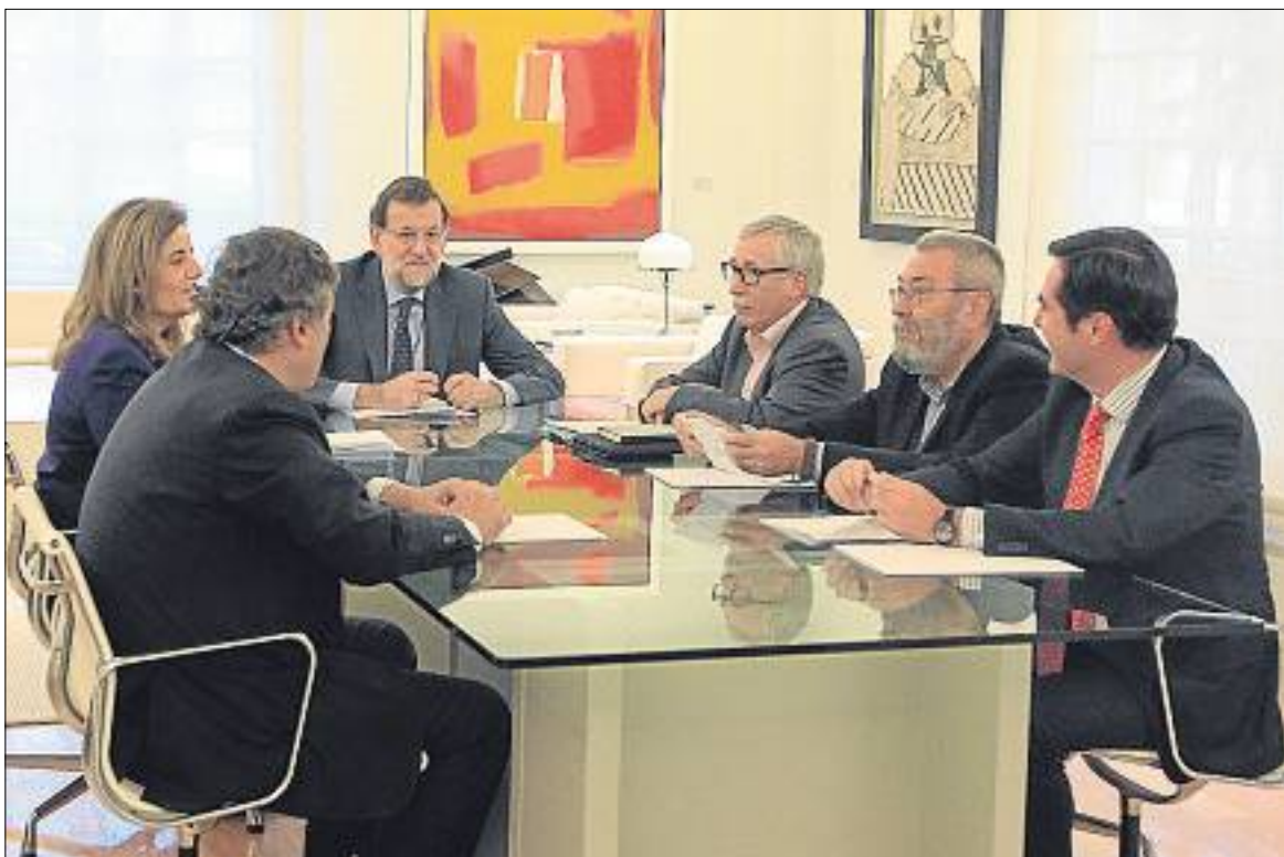
Una imatge de la reunió d'ahir a la Moncloa

Entrant més en detall, fonts coneixedores de la negociació expliquen que la compatibilitat amb una feina remunerada se cenyirà als contractes a temps parcial –com ja passa amb la prestació d'atur–, en entendre que responen a l'objectiu prioritari que “tornin a treballar”. El pla està destinat a aturats amb experiència laboral que faci almenys tres anys que no treballin –ja han esgotat la prestació d'atur, el pla Prepara, la renda activa d'inserció–. No hi ha confirmació oficial sobre la quantia de l'ajuda, que podria ser de prop de 400 euros si es manté la línia marcada en anteriors reunions. Tampoc no han quedat especificats els requisits per beneficiar-se d'aquesta ajuda. En