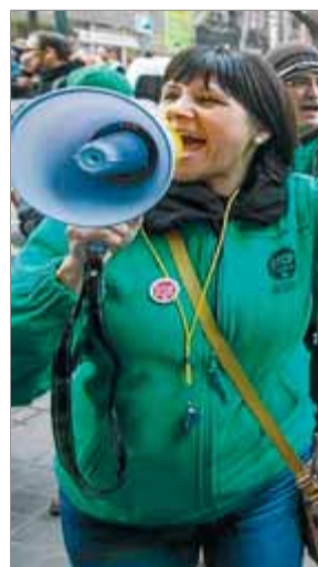
Acció de la PAH, ahir a Barcelona ■ ALBERT SALAMÉ

La Plataforma d'Afectats per la Hipoteca (PAH) s'ha aliat amb activistes de Nova York i San Francisco, als Estats Units, per organitzar accions conjuntes contra el fons d'inversions americà Blackstone, que, el juliol de l'any passat, va comprar una cartera d'actius hipotecaris de CatalunyaCaixa. Les 77 assemblees de la PAH van celebrar ahir una concentració a la plaça Catalunya de Barcelona. ■ EFE