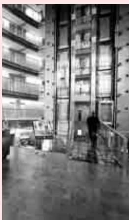
Hotel Solvasa Barcelona.

Un grupo francés compra el hotel Solvasa de Barcelona P5