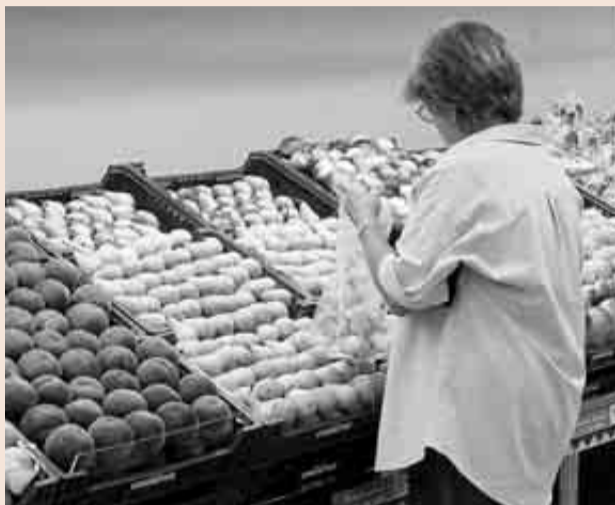
El sector agrícola se ha visto castigado por el conflicto con Rusia.

Pese al buen tono del sector exportador, el déficit comercial se disparó un 41,4%, hasta 11.695,6 millones de euros. Esto se debe al incremento del 7,9% en las importaciones, que alcanzaron los 71.890 millones y revelan un repunte de la demanda interna. Ésta se produce tanto en el consumo