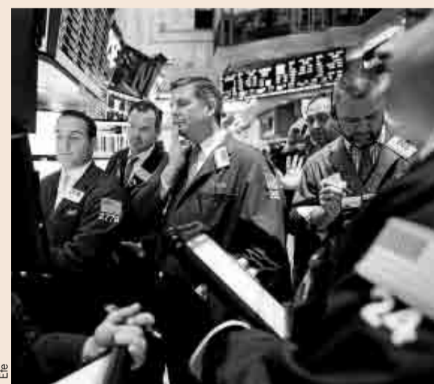
Crece el número de fondos que financian empresas.

Dos tercios de los 1.500 inversores institucionales registrados por Preqin declararon que aumentarían su exposición a los préstamos directos porque esperan retornos anuales del 8%-14%.